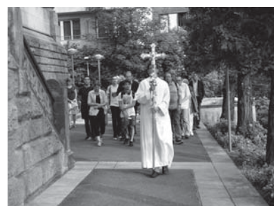
Fronleichnamsprozession um die Liebfrauenkirche im Anschluss an die Jubiläumsfeier