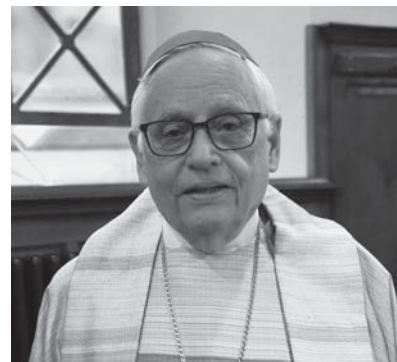
em. Weihbischof Paul Vollmar, Generalvikar in Zürich von 2003–2009