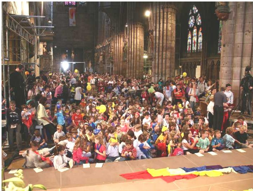
Gottesdienst im Freiburger Münster anlässlich des Diözesantags für Familien 2009

Zusammenfassend möchte ich die Pfarrei St. Stephan in Männedorf zitieren, die das Anliegen, das ich mit pastoraler Familienarbeit verbinde, so formuliert hat: „Die Kirche versteht sich auch als «familia dei», als Familie Gottes. Eine Familie, in der alle zählen, in der Grosse und Kleine wichtig sind, in der alle gleichberechtigt mitwirken dürfen, alle miteinander Reich Gottes leben, die an einer Welt mitarbeiten, in der solidarische Gemeinschaft und persönliche Freiheit wachsen, Frieden, Gerechtigkeit und gute Lebenschancen für alle.“