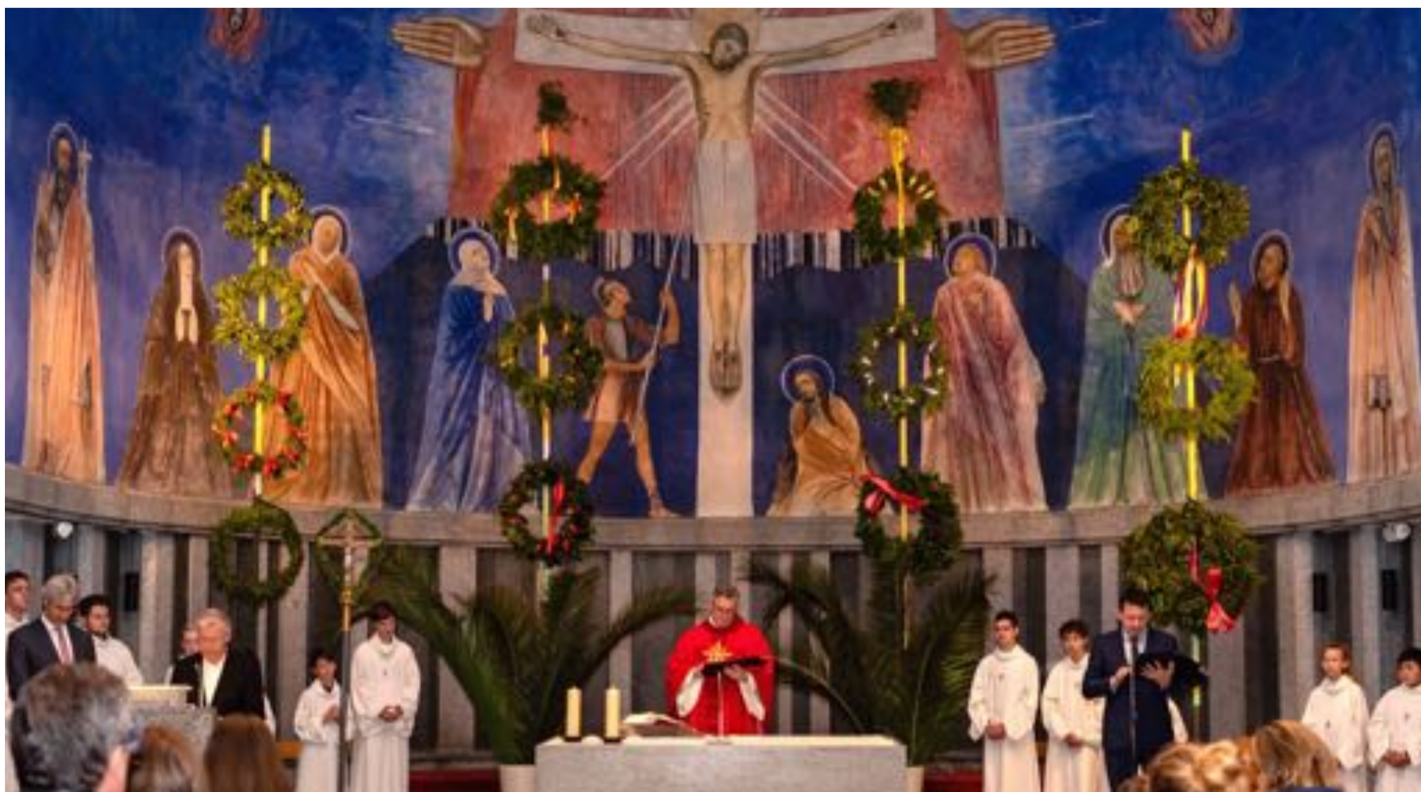
Kapryśna kwietniowa pogoda odrobinę zakłóciła tradycyjny przebieg upamiętnienia triumfalnego wjazdu Jezusa do Jerozolimy w PMK w Zurychu.

Tym razem odbyło się bez procesji na placu przy kościele Herz Jesu. Mimo to las kolorowych palemek radośnie triumfował we wnętrzu przepełnionej świątyni. Odczytana Męka Pańska z Ewangelii wg św. Łukasza oraz niemalejące kolejki do konfesjonatów wprowadziły nas w duchowe przeżywanie Wielkiego Tygodnia.